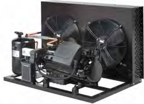
Компрессорно-конденсаторные агрегаты с полугерметичными компрессорами Stream и системой диагностики CoreSense™

Наличие сертификатов на использование нескольких хладагентов и широкий ассортимент принадлежностей увеличивают возможности при конфигурировании систем.