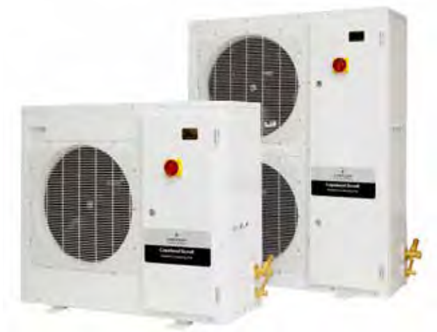
Холодильные агрегаты для установки вне помещений Copeland EazyCool ZX со спиральными компрессорами