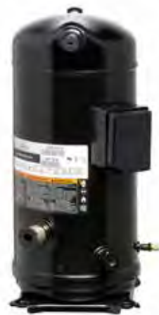
ZH*KCE спиральные компрессоры для рекуперации тепла

Модельный ряд включает компрессоры различной мощности: от ZH40KCE (7,5 л. с.) до ZH150 (30 л. с.), которые можно использовать в тандемном режиме.