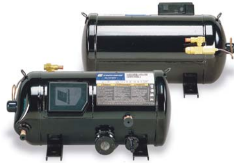
Горизонтальные спиральные компрессоры

В основе конструкции компрессоров серии ZRH лежит уникальная технология Copeland Scroll™, поэтому эти модели столь же надежны, как и обычные компрессоры Copeland Scroll™. Кроме того, в них используется специальный масляный насос, оптимизированный для систем воздушного кондиционирования транспортных средств. Как правило, компрессоры этой серии имеют горизонтальное исполнение. Малая высота и возможность регулирования производительности компрессора ZRH являются идеальным ответом на требования этого рынка.