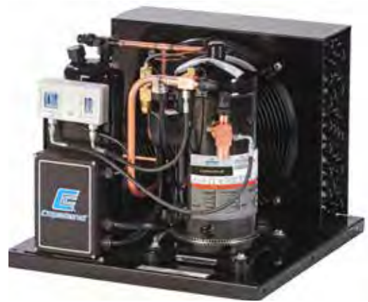
Компрессорно-конденсаторные агрегаты Copeland Scroll для установки в помещениях